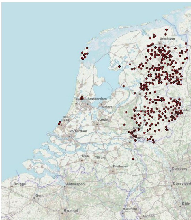
Locaties vreugdevuren in Nederland (x, y coördinaten)